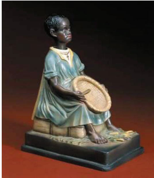
Abb. 6: Nickneger; Missionsspardose, Inv. Nr. 2020.4:4

man zunächst der Jahreszahlangabe im Internet nicht: Kolorierte Gipsskulptur. Deutschland, 1998 . Aus der weiteren Erläuterung geht hervor, dass der ‚Nickneger‘ im christlichen Devotionalienhandel im Wallfahrtsort Kvelaer erworben wurde und ähnliche Figuren durchaus noch in Kirchen ausgestellt werden.