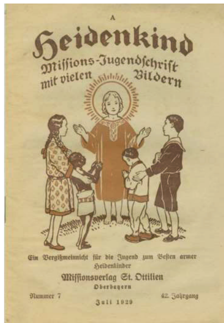
Abb. 3: Heidenkind

Dass die christlichen Missionen im 19. und 20. Jahrhundert bis in die Gegenwart hinein auch mediale Unternehmungen waren, verdeutlichen die zahlreich im Umlauf befindlichen Missionszeitschriften für Kinder, die mit ihrer Bildersprache die skizzierten Menschenbilder und Beziehungsstrukturen verstärken. 29 Unter den Prämissen einer gegenwärtigen Political Correctness muten manche Titel sicher äußerst befremdlich an: Unverdächtig sind Bezeichnungen wie Kontinente , Brücke zur Heimat , Katholische Missionen oder Echo aus Afrika , 30 das skizzierte Missionsverständnis spiegelt sich dann in Titeln wie Heidenkind , Licht der Heiden , Evangelischer Heidenbote , Missionsglöcklein oder Stern von Afrika wider. Aus heutiger Perspektive wären natürlich alle Titel in Verbindung mit dem N-Wort ein No-Go: Negerkind oder Stern der Neger . Eine weit verbreitete Zeitschrift der Steyler Missionare, Weite Welt (von 1921 bis 1971 unter dem Titel Der Jesusknabe ), wurde erst 2018 eingestellt. 31