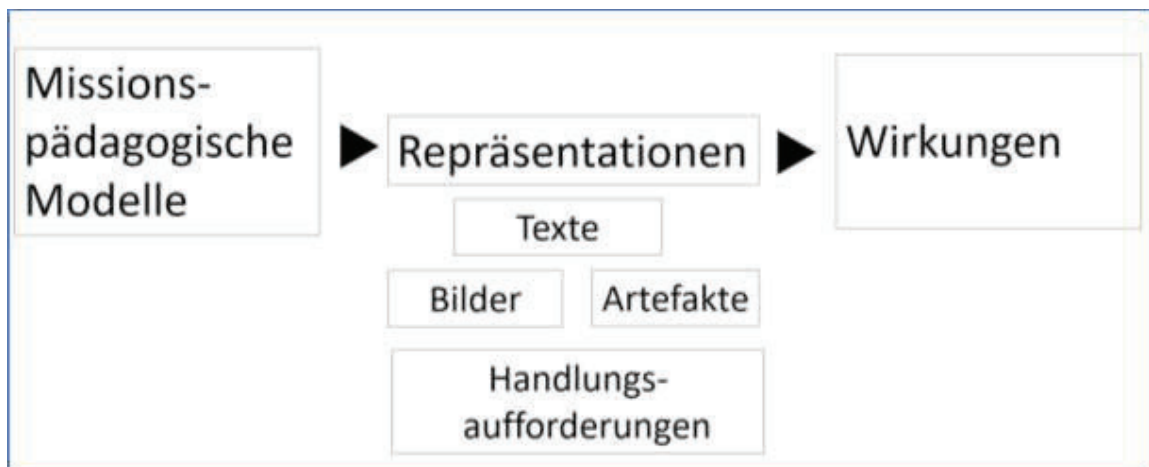
Abb. 1: Repräsentationen

Wie wurden und werden solche Konzepte faktisch wirksam? Dies soll im Folgenden exemplarisch am Beispiel der Missionspädagogik untersucht werden. Vor allem interessiert in einem zweiten Schritt, welche Wirkungen die entsprechenden Repräsentationen bei den Rezipient*innen entfalteten.