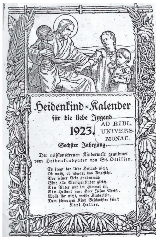
Abb. 4: Heidenkindkalender

Diese Zeitschriften transportierten vor allem durch das Bildmaterial vielfältige Eindrücke von fernen Ländern, Kulturen, Ethnien und Menschen. Die folgende Analyse, exemplarisch durchgeführt an zwei Titelbildern, fokussiert sich auf die Beziehungsstruktur der dargestellten Personen: Die Abbildung rechts stammt aus der Missionszeitschrift mit dem bezeichnenden Titel Heidenkind , später Licht der Heiden , die im Missionsverlag St. Ottilien erschien; das Titelblatt des Juli-Hefts aus dem Jahr 1929 verdeutlicht das skizzierte Missionsverständnis: Um das übergroße Jesus-Kind mit einer Gloriole und ausgebreiteten Händen versammeln sich links und rechts je zwei Kinder; links umarmt ein größeres, weißhäutiges Mädchen mit Zöpfen und Kleid sehr entschieden ein kleineres, dunkelhäutiges Mädchen, rechts ein weißhäutiger, großer Junge einen Jungen, der vermutlich aus einem asiatischen Kulturkreis stammen sollte; auch die Geschlechtszuordnung ist kirchlich korrekt! Beide (um in der Terminologie der Zeit zu bleiben) Heidenkinder sind schon auf dem rechten Weg , denn sie falten fromm die Hände. Ein Beleg, dass die Wirkkraft der Bilder in der Zeitschrift nicht zufällig, sondern absichtlich inszeniert wurde, zeigt sich auch im Untertitel: Missionszeitschrift mit vielen Bildern .