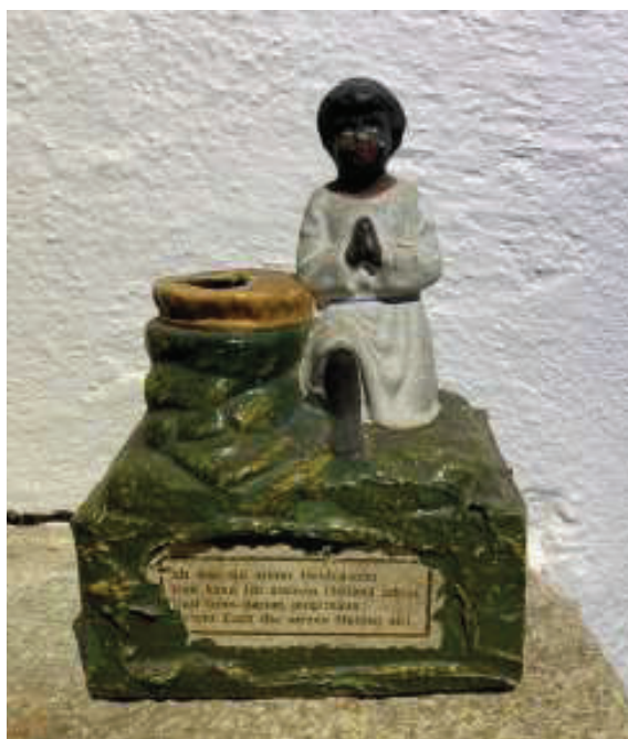
Abb. 5: Nickneger-Tittling.

Im Bauernhofmuseum bei Tittling befindet sich eine entsprechende Sammelbüchse aus der Wende vom 19. zum 20. Jahrhundert. Der farbig bemalte Aufsatz mit Öffnung und Mohr aus Papiermaché enthält folgende Aufschrift: 36